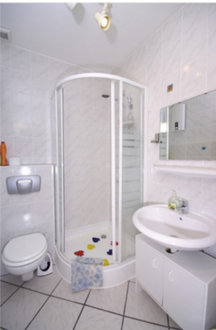
WOHNUNG -1- BADEZIMMER