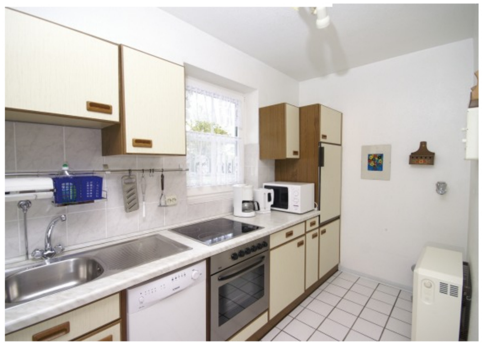
WOHNUNG -1- KÜCHE