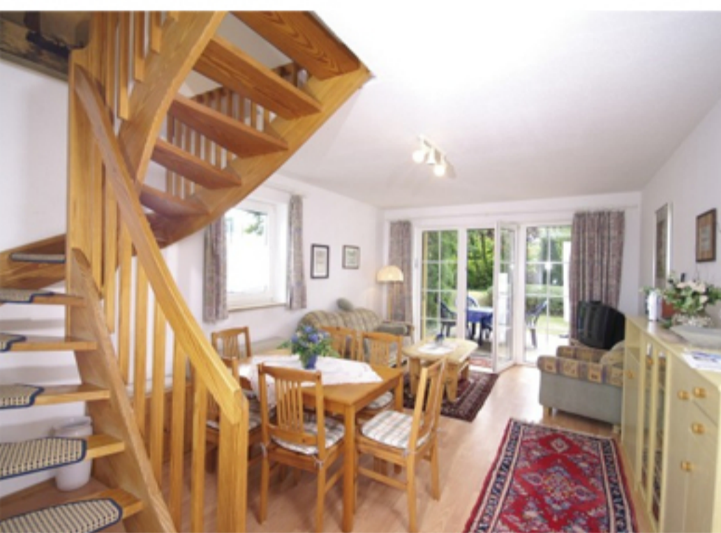
WOHNUNG -1- WOHNRAUM MIT AUFGANG ZUM OBERGESCHOSS