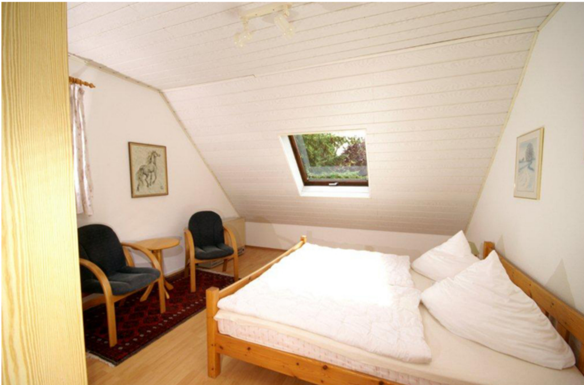
WOHNUNG -1- SCHLAFZIMMER (OBERGESCHOSS)

Drei separate Ferienwohnungen für 2-5 Personen, komplett eingerichtet. Wohnzimmer, TV, 1-3 Schlafräume, Kinderbett und Kinderhochstuhl, Küche mit Geschirrspüler, Dusche, Terrasse, Spielwiese. Absolut ruhige Lage, Nähe Yachthafen, 5 Minuten zum Strand und Kurzentrum.