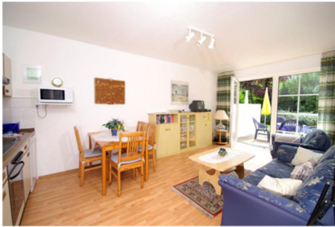
WOHNUNG -2- WOHNZIMMER MIT OFFENER KÜCHE

Drei separate Ferienwohnungen für 2-5 Personen, komplett eingerichtet. Wohnzimmer, TV, 1-3 Schlafräume, Kinderbett und Kinderhochstuhl, Küche mit Geschirrspüler, Dusche, Terrasse, Spielwiese. Absolut ruhige Lage, Nähe Yachthafen, 5 Minuten zum Strand und Kurzentrum.